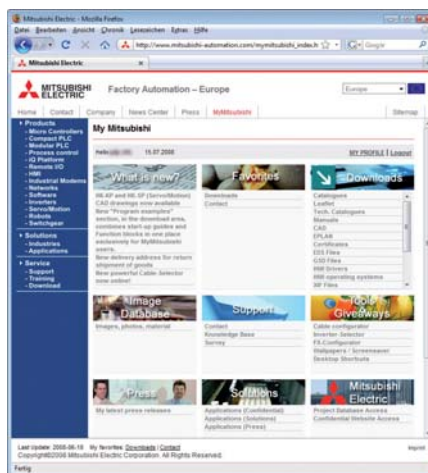
W strefie MyMitsubishi jest duża ilość narzędzi i upominków.

Asortyment naszych wprowadzających podręczników oraz przewodników dla początkujących daje podstawową informację, w jaki sposób zorganizować wiele prostych zadań z automatyki i uruchamiać je bez większego zamieszania.