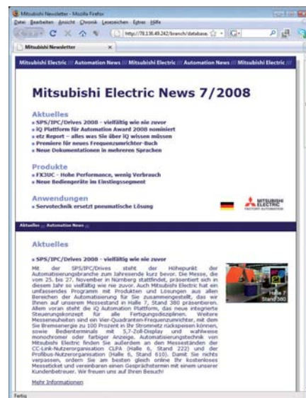
Dzięki biuletynowi Mitsubishi jesteś zawsze na bieżąco.

Zawsze na bieżąco: nic już nie umknie prenumeratorom naszych elektronicznych biuletynów. Jeden raz w miesiącu każdy abonent otrzyma najnowsze informacje ze świata technologii automatyki Mitsubishi. Opisywane w nich zagadnienia zawierają najnowsze informacje o produktach,