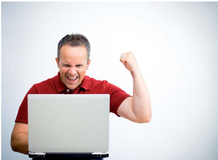
Na stronie MyMitsubishi możesz znaleźć wszystko, czego Ci trzeba.