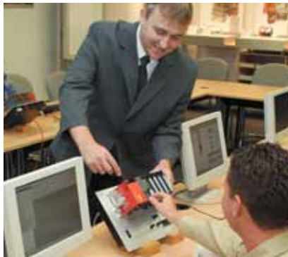
Interaktywne centra szkoleniowe

Uwaamy, e ta wsppraca inynierw miejscowych i japoskich zapewnia naszym klientom najrozleglejsz sie obsugi produktw automatyzacji produkcji firmy Mitsubishi Electric, ulatwiajc naszym klientom szybkie i skuteczne osignicie wyników.