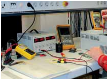
Wszystkie naprawy wykonywane s przez wykwalifikowanych i dowiadczonych inynierw

Nasi inynierowie mog odpowiedzie na zapytania dotyczce produktw automatyzacji produkcji. Ponadto, moemy