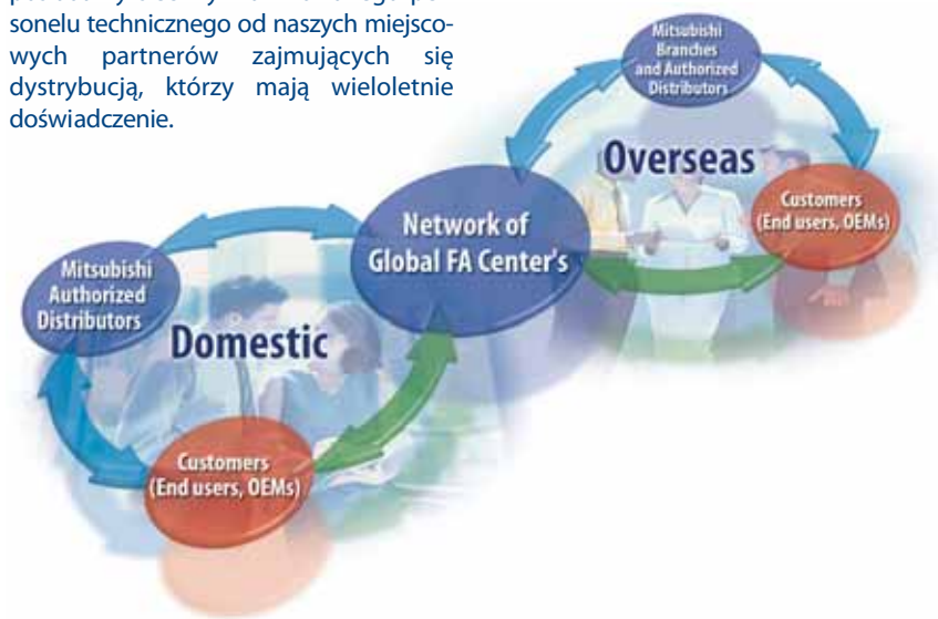
Serwis i obsuga na całym świecie

Posiadanie bardzo wykwalifikowanych inynierw w kadym centrum automatyzacji produkcji oznacza, e moemy rowniez oferowa serwis i naprawy zarówno miejscowo, jak i organizowane przez nasz Europejsk Grup Serwisow (European Service Group). Poprzez wykorzystanie siy wszystkich centrw automatyzacji produkcji, partnerw zajmujcych si dystrybucj oraz serwisem w caej Europie moemy zapewni, e nasi klienci otrzymuj elastyczny serwis - wtedy, kiedy go najbardziej potrzebuj.